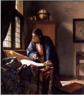
Vermeer, Il Geografo - 1668